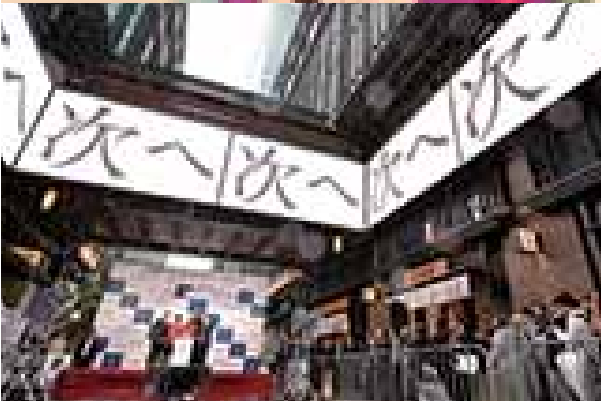
テーマ「街づくり」日本橋シテイドレッシング for TOKYO 2020(三井不動産(株))