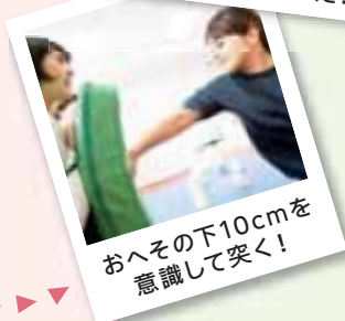
おへその下10cmを 意識して突く!