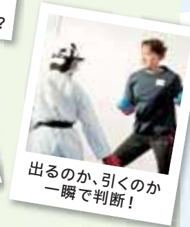
出るのか、引くのか 一瞬で判断!