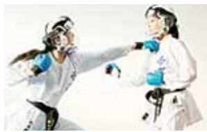
練習では安全のため、頭部防具を着用しています。