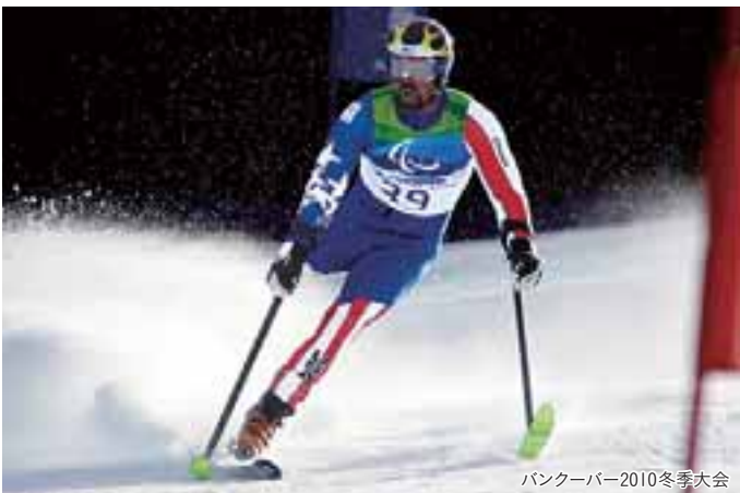
バンクーバー2010冬季大会

自信を打ち砕かれたと同時に、強い想いが込み上がった。誰よりもこのスポーツを追いかけてやろうと。