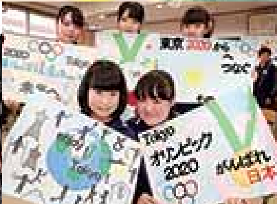
テーマ「復興」郡山市立行健中学校におけるオリンピック・パラリンピックに関するポスター制作授業公開