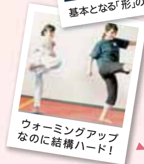
ウォーミングアップ なのに結構ハード!