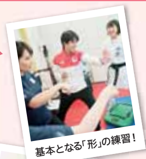
基本となる「形」の練習!