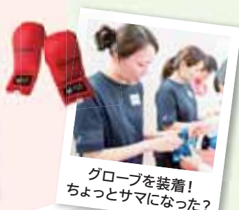
グローブを装着! ちょっとサマになった?