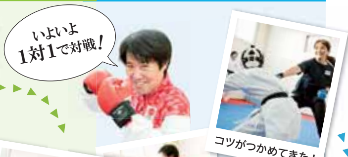
いよいよ 1対1で対戦!