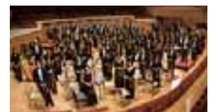
オリンピックの記念文化事業として設立された東京都交響楽団も、東京1964大会のレガシーです。

するピクトグラムの普及やホテルのユニットバスの誕生も、東京1964大会のレガシーと言われていています。このような大会後も残り続けるレガシーの創出を目指して、東京2020組織委員会一丸となって大会準備に取り組んでいます!